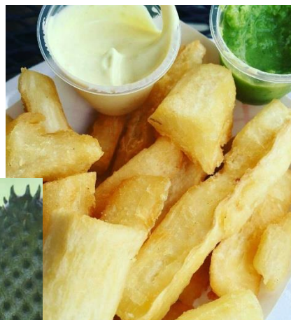
Yuca con suero