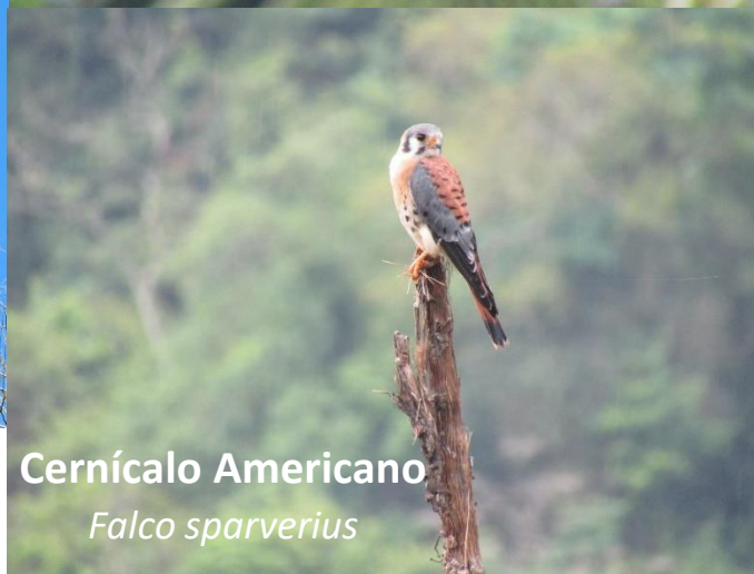
Cernícalo Americano Falco sparverius

NIT: 901.184.843-1 * RNT AVO: 192557 Corregimiento La Palmita - Vereda La Conquista La Jaga de Ibirico - Cesar