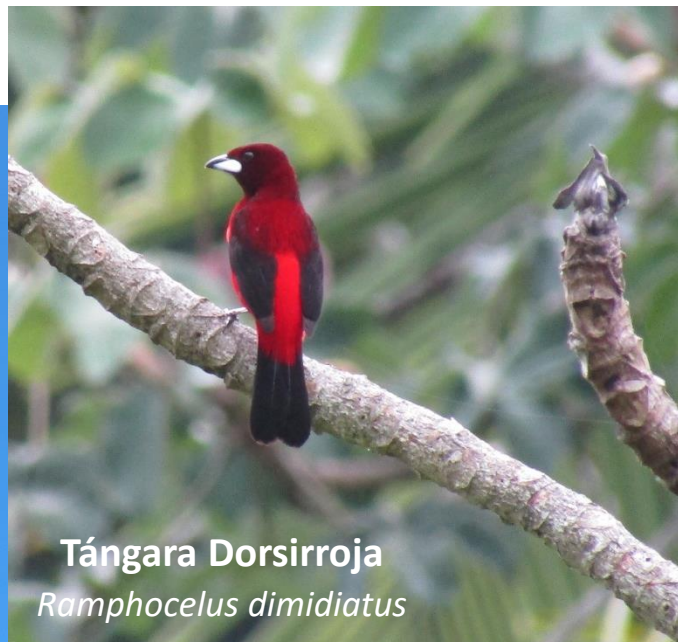
Tángara Dorsirroja Ramphocelus dimidiatus