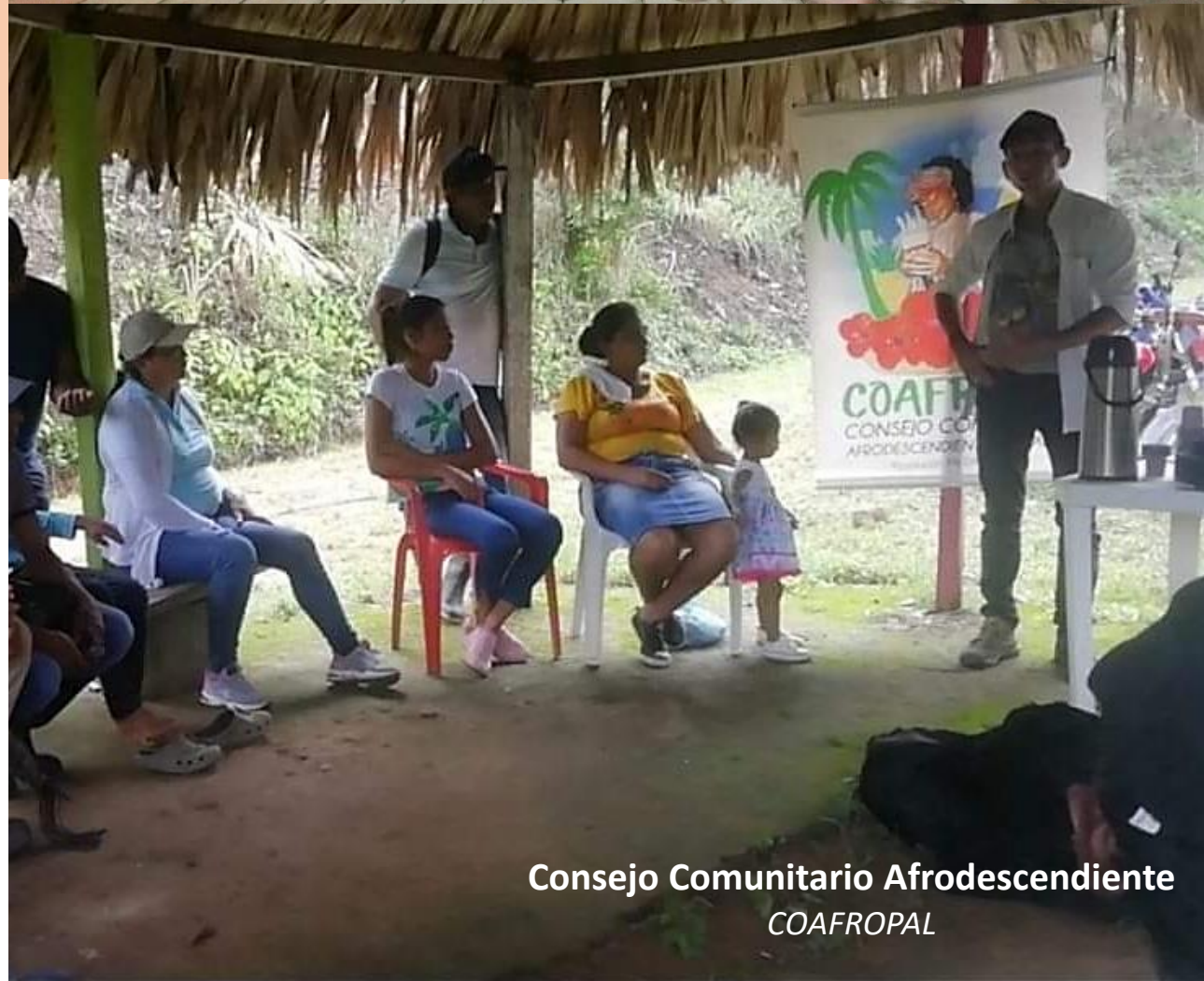
Consejo Comunitario Afrodescendiente COAFROPAL