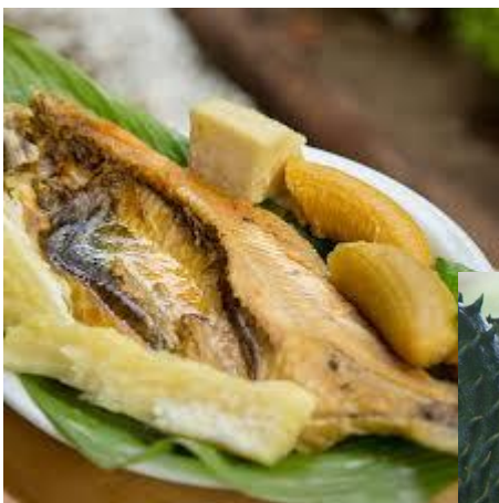
Viuda de Pescado

En todos nuestros recorridos, la gastronomía local y la cocina tradicional hacen parte de las delicias campesinas que ofrecemos a turistas y visitantes.