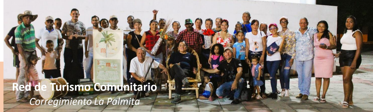
Red de Turismo Comunitario Corregimiento La Palmita

NIT: 901.184.843-1 * RNT AVO: 192557 Corregimiento La Palmita - Vereda La Conquista La Jaga de Ibirico - Cesar