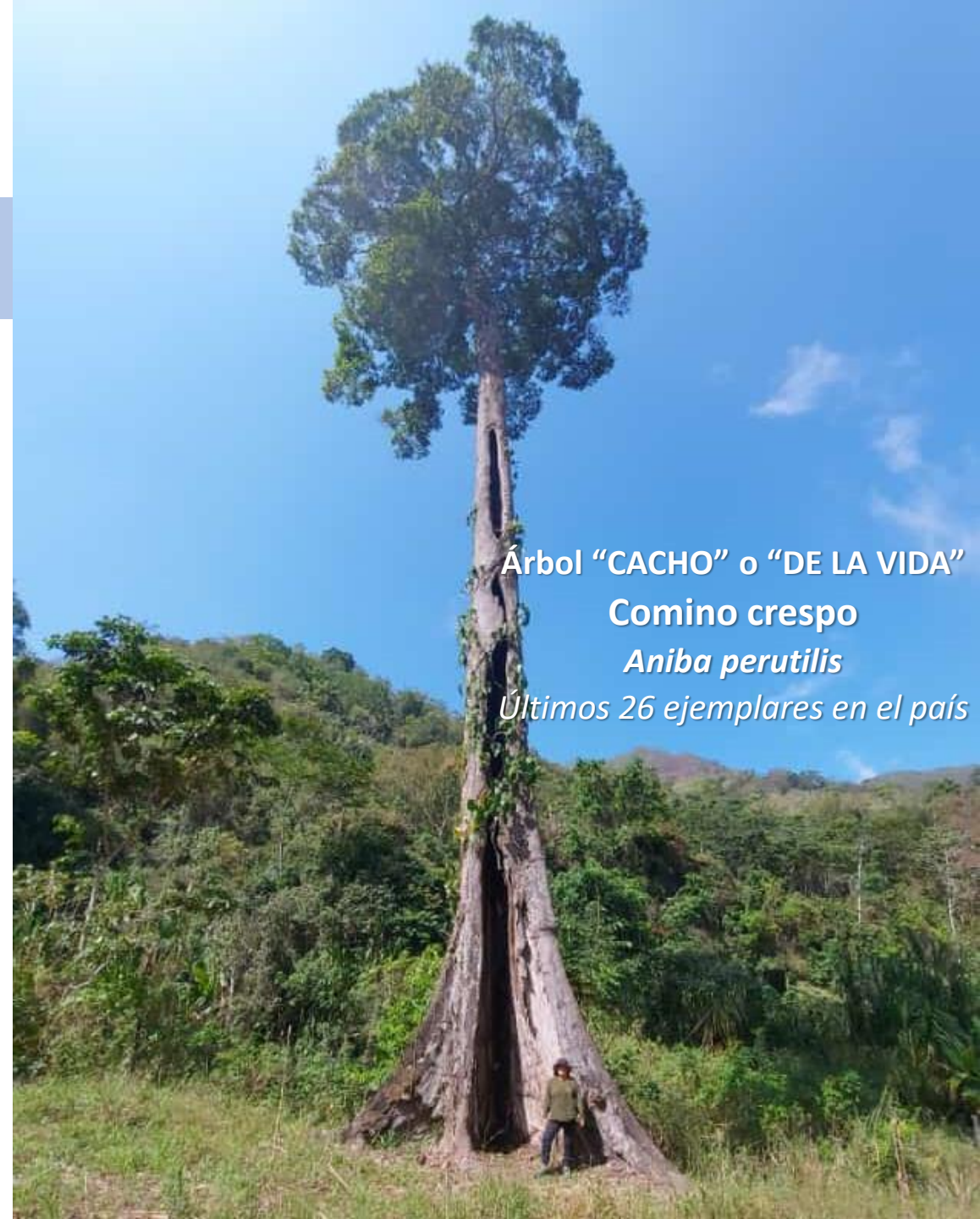
Árbol “CACHO” o “DE LA VIDA” Comino creso Aniba perutilis Últimos 26 ejemplares en el país

NIT: 901.184.843-1 * RNT AVO: 192557 Corregimiento La Palmita - Vereda La Conquista La Jagua de Ibirico - Cesar